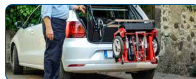
Sollevatore automatico per bagagliaio Automatic hoist for car boot