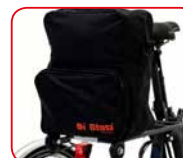
Borsello Shopping bag