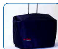
Sacca custodia Carry case