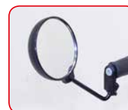
Specchietto Rearview mirror